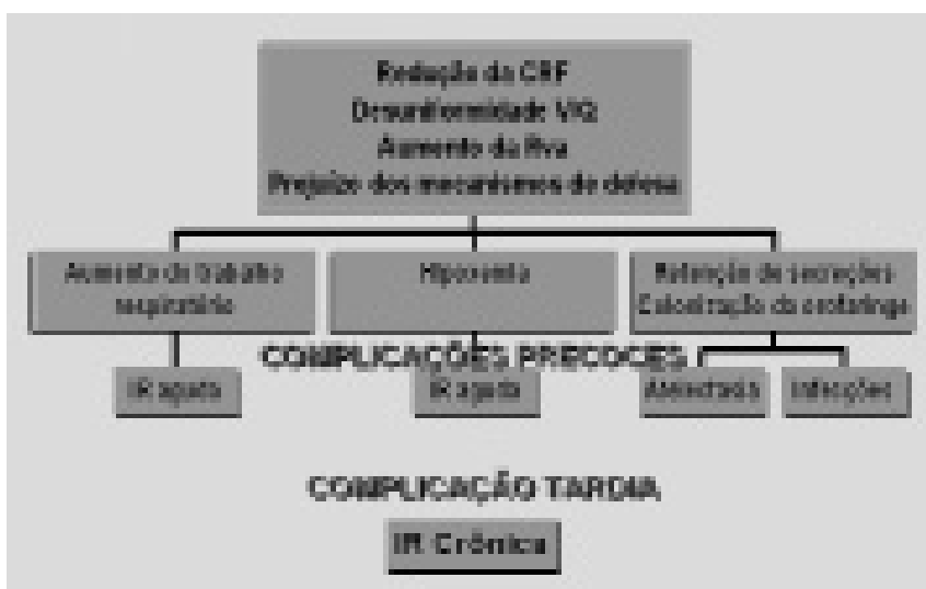
FIGURA 1. ALTERAÇÕES QUE OCORREM NO APARELHO RESPIRATÓRIO, SECUNDÁRIAS AO ATO CIRÚRGICO. (CRF = CAPACIDADE RESIDUAL FUNCIONAL; V/Q = VENTILAÇÃO/PERFUSÃO; Rva = RESISTÊNCIA DE VIAS AÉREAS; IR = INSUFICIÊNCIA RESPIRATÓRIA)

Em um estudo de coorte com 706 asmáticos submetidos a procedimento cirúrgico, a ocorrência de complicações graves não dependeu do tipo de anestesia, pois ocorreram 12 complica-