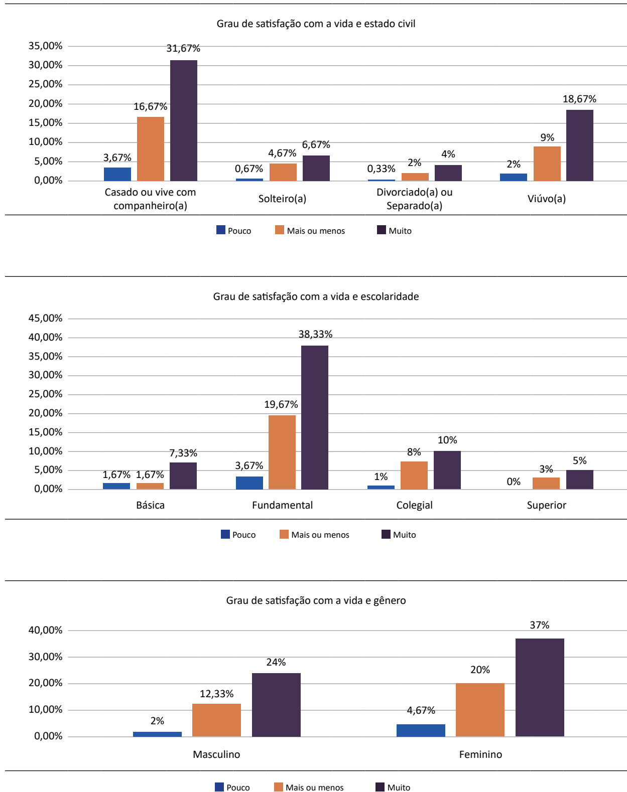
Figura 1. Percentuais de respostas relativas à satisfação com a vida comparada entre os grupos de idosos referentes aos níveis de escolaridade, do estado civil e do gênero